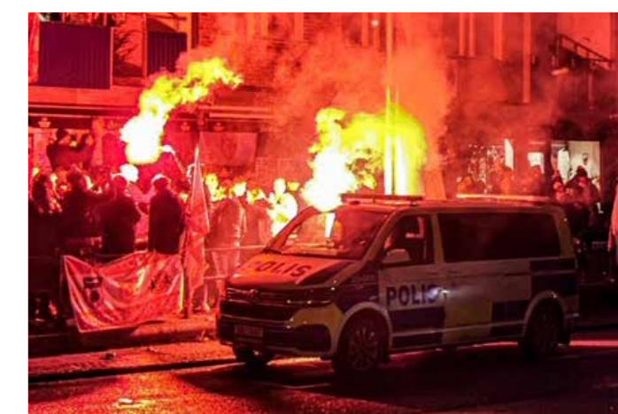
Fyrverkeri i rondellen. Polis utanför Bosna.