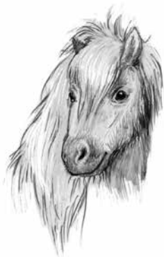
Hilma, 2 år. Fux utan tecken, 79 cm hög. (u: Isa)

Med i flocken är också de tvååriga ungstona Hilma, Tindra och Smilla. De är bästa vänner och gör nästan allt tillsammans. Bokstaven u står för undan och berättar vem deras mamma är.