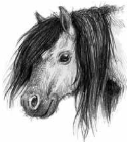
Tindra, 2 år. Mörkbrun med en stjärn i pannan, 75 cm hög. (u: Zoe)