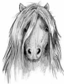
Smilla, 2 år. Mörkgrå skimmel, 77 cm hög. (u: Bianca)